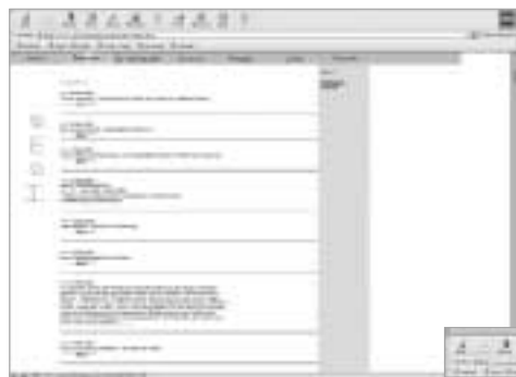
Auf der Startseite finden Pferdefreunde regelmäßig aktuelle News oder Aktualisierungen der Site.