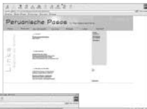
Umfangreiche Link-sammlungen fördern zum Stöbern auf.