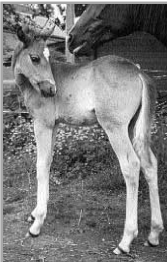
Romancero HK geb. 1998, Fuchshengst aus der Marequita PT