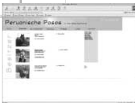
Besitzer stellen sich und ihre Pferde auf einer eigenen Seite vor.