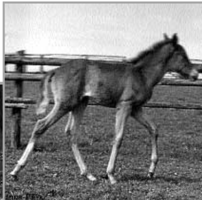
Diadema PT , geb. 1997 Fuchsstute aus der Diana DLG