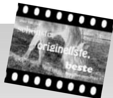
Bild- und Nutzungsrechte gehen an die PPV über. Die Bilder werden ins PPV-Archiv aufgenommen und bei Bedarf in Artikeln über die Paso Peruanos veröffentlicht.

Die drei besten Bilder werden prämiert und den Gewinnern winken schöne Preise: