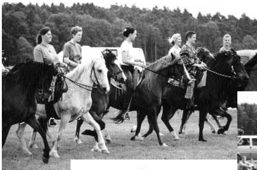
Barrida auf dem T.A.G.D