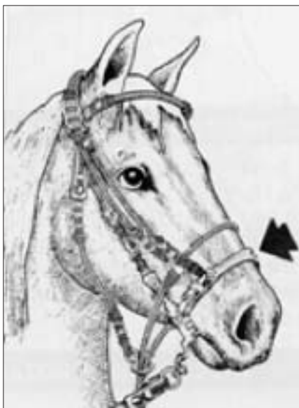
Zäumung mit Gamarilla

chen oder ungebrochen sein kann. Ich bevorzuge das gebrochene Gebiß, da es flexibel ist. Dies hilft die Stelle zu schonen wo das Gebiss liegt. Nun spüren sie erneut, wie sensibel das Maul des Pferdes ist, es wird sich schon dadurch verändern, indem Sie das Gewicht des Bozals wegnehmen. Sie müssen es wieder an das Gebiss allein gewöhnen, dieses Mal mit