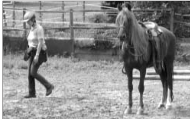
Sandra und Calimero

Die Zeit bis zur Siegerehrung wurde im Hof bei Steak und Würstchen und netten Gesprächen verbracht. Nachdem alles ausgewertet war, sammelten sich alle Teilnehmer mit ihren Pferden auf dem Reitplatz und der Bürgermeister von Gau-Weinheim nahm die Siegerehrung höchstpersönlich vor.