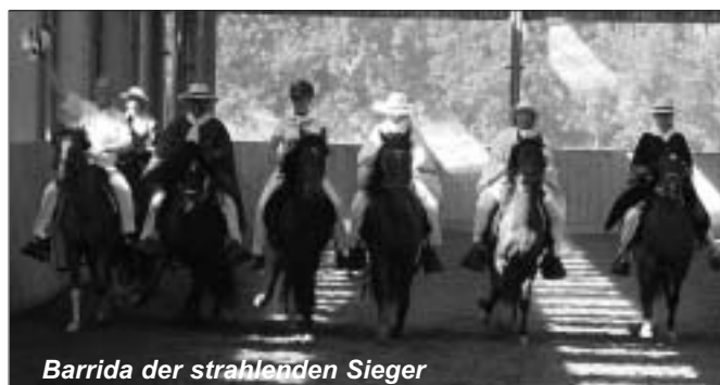
Barrida der strahlenden Sieger

Grundsätzlich ist es uns sehr wichtig eine korrekte Darstellung in der Presse zu veröffentlichen aber über diese "Interpretation" haben wir uns doch königlich amüsiert.